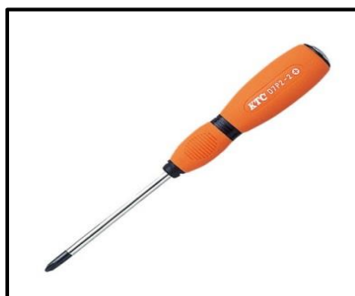
プラスドライバー

本製品の初期不良でのお問い合わせはご購入された販売店もしくは下記の電話番号へご連絡ください。